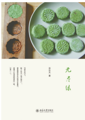
《无尽绿》 宋乐天 著 北京大学出版社

小说的语言清浅流利。比如，小说开头写花儿与少女的类比，一个像蓓蕾一样的少女，不准备轰轰烈烈地去争奇斗艳，而要轰轰烈烈地去死。“我”对于这个花儿一样的少女（小姑）的眷恋，象征了人性中对美好的向往，对命运不公的不屈抗争，而这正是塑造我们这部人类心灵史的所有渺小的“我”汇集而成的力量，是我之所以成为“我”的根本。