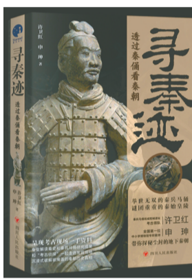
《寻秦迹》 许卫红 申申 著 四川人民出版社

这是一本以植物为主角的江南风物散文集，涉及回忆、考证、民俗与工艺。在植物的自然属性与所给人的美的愉悦之外，突出的是植物与人的日常相关的“物用”，以及这种“物用”和人发生联系以后，在人的生活中所产生的情感。因为有亲身经历和亲手经验做底子，所以写起来不虚，文字朴素而真切动人。春日连绵照眼的紫云英与新绿茶树，于合适季节亲手制作出的乌糯米饭与木莲豆腐，还有秋日香气沉沉的桂花晴雨录，这些都是我们置身其中、日常生活里鲜明的“无尽绿”。