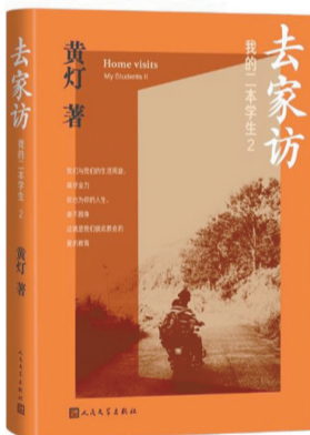
《去家访：我的二本学生2》 黄灯 著 人民文学出版社

秦始皇“收天下之兵”到底是真是假，政策的实施是否有弹性？“暴秦”对敌死的士卒有一套严格的发表流程，是否可为我们解开一点点“秦国会为何会统一天下”的疑惑？武力征伐不代表秦文化，更不是中华文明，要真正看懂兵马俑，我们就不能局限于秦军所向披靡的军事传奇，而应该去多了解兵马俑及兵器所体现的包容性、多元性，这才是秦文化更真实的面貌。