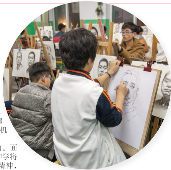
▲ 美术特长班学生在训练。

改革创新谋发展，奋进崛起谱新篇。面对新的历史机遇和挑战，广宗县第一中学将继续发扬自强不息、追求卓越的一中精神，以办好人民满意的教育为目标，为国家培养更多德智体美劳全面发展的社会主义建设者和接班人。 (韩国栋)