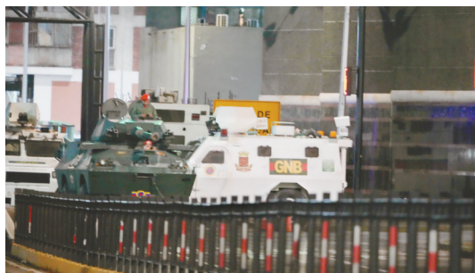
这是1月3日凌晨在委内瑞拉首都加拉加斯的总统府附近拍摄的军用车辆。

据美媒报道,特朗普在其首个任期就曾试图推翻马杜罗,认为委内瑞拉丰富的石油等自然资源储备会给美国带来经济利益。鲁比奥去年1月任国务卿以来,也一直在为推动委政权更迭做准备,其上任后首次出访就是中美洲和加勒比地区的五国之行。